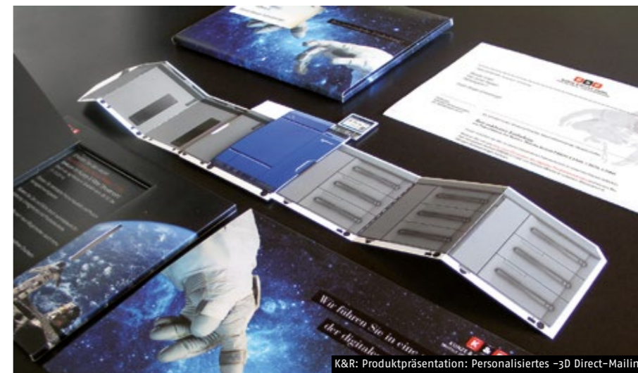
K&R: Produktpräsentation: Personalisiertes -3D Direct-Mailing