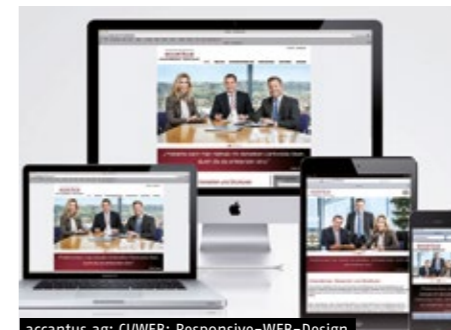
accantus ag: CI/WEB: Responsive-WEB-Design